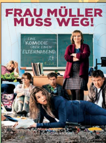
Frau Müller muss weg