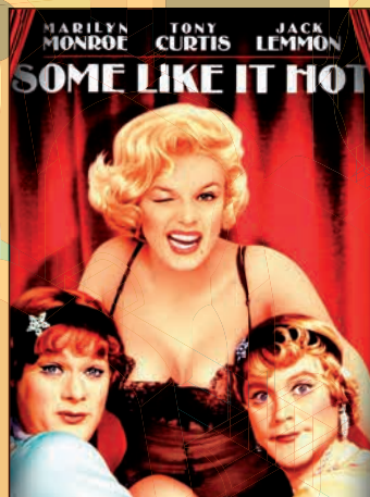
Some like it hot