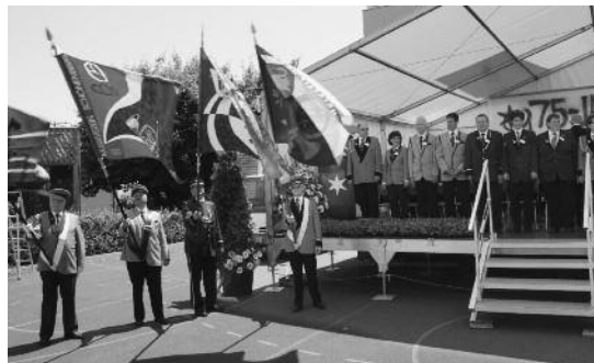
Veteranenehrung der Musikvereinigung Zürichsee linkes Seeufer und Sihltal