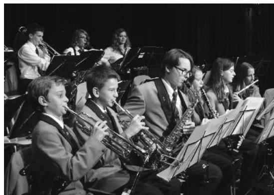
Mit dem kleinen Spiel hatte auch der Nachwuchs seinen grossen Auftritt