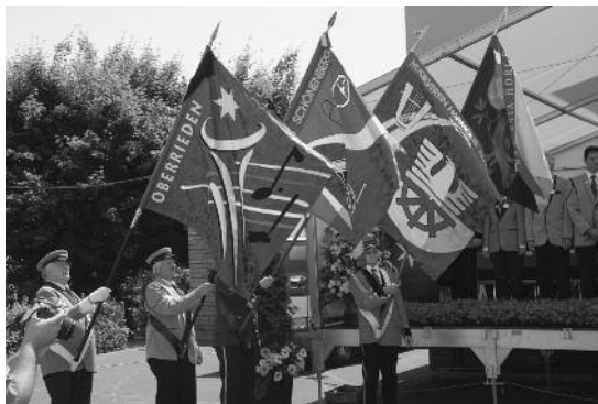
Die Fahnen verschiedener umliegender Musikvereine