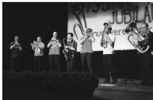
Mit viel Spielwitz und Humor begeisterten Humpa Brass das Publikum