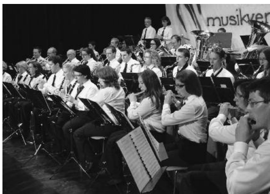
Der jüngste 75-jährige Verein...