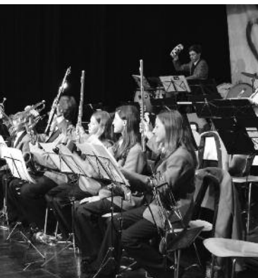
für das kleine Spiel