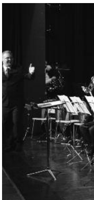
Jede Menge Applaus