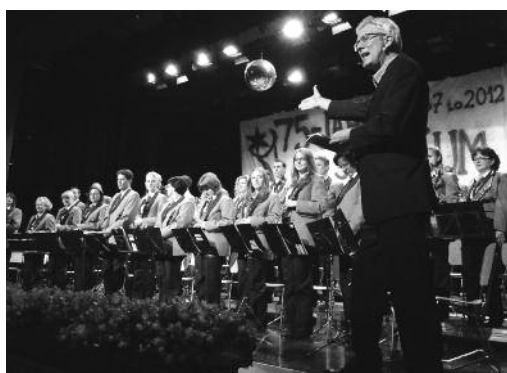
Der Musikverein Oberrieden in seiner neuen (einheitlichen) Uniform