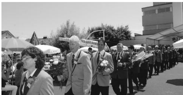
Die stolzen Veteranen nach ihrer Ehrung für ihr langjähriges Musizieren